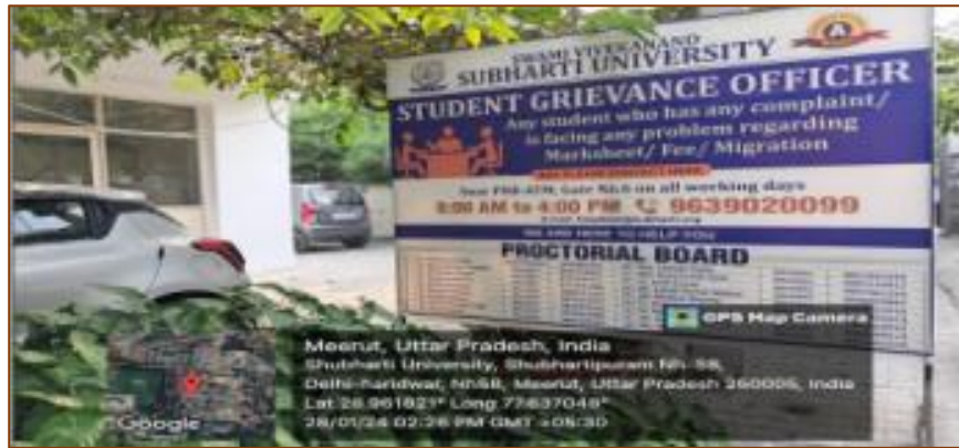
Site of Grievance Office