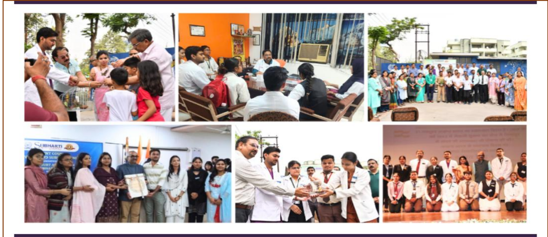
Activities conducted by Students' Council Committee

The University Student Council serves as a key channel for communication between the students and the University administration.