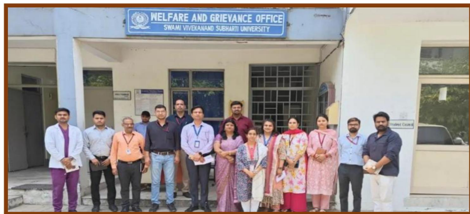
Grievance & Redressal Committee

The Student Grievance & Redressal Committee at Swami Vivekanand Subharti University was created to address students' academic, administrative, and personal issues in a fair and transparent manner. The committee provides a structured approach for students to express their grievances and seek timely solutions while ensuring fairness and confidentiality. Its goal is to maintain a positive academic environment by promoting student welfare, efficiently resolving disputes, and building stronger trust between students and the university administration.