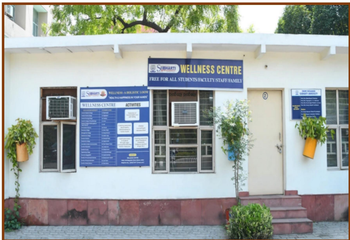
Wellness Centre "Self-actualization through holistic well-being"

Expert professionals, including holistic physicians, psychiatrists, psychologists, naturopathy and yoga consultants, and preventive healthcare specialists, offer free counseling services. Outreach workshops are regularly held for students, faculty, and staff to enhance emotional resilience and career readiness.