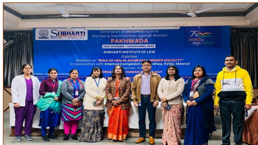
Seminar organized by Internal Complaints Committee (ICC)

5. Internal Complaints Committee (ICC) - In accordance with the Sexual Harassment of Women at Workplace (Prevention, Prohibition and Redressal) Act, 2013, Swami Vivekanand Subharti University in Meerut has set up an Internal Complaints Committee (ICC) to safeguard women against sexual harassment in the workplace. The committee, established for a three-year period, aims to ensure a safe, respectful, and gender-sensitive atmosphere for all female students, faculty, and staff on campus. The ICC is responsible for preventing and addressing cases of sexual harassment within the university by receiving complaints, conducting impartial investigations, and implementing necessary actions.