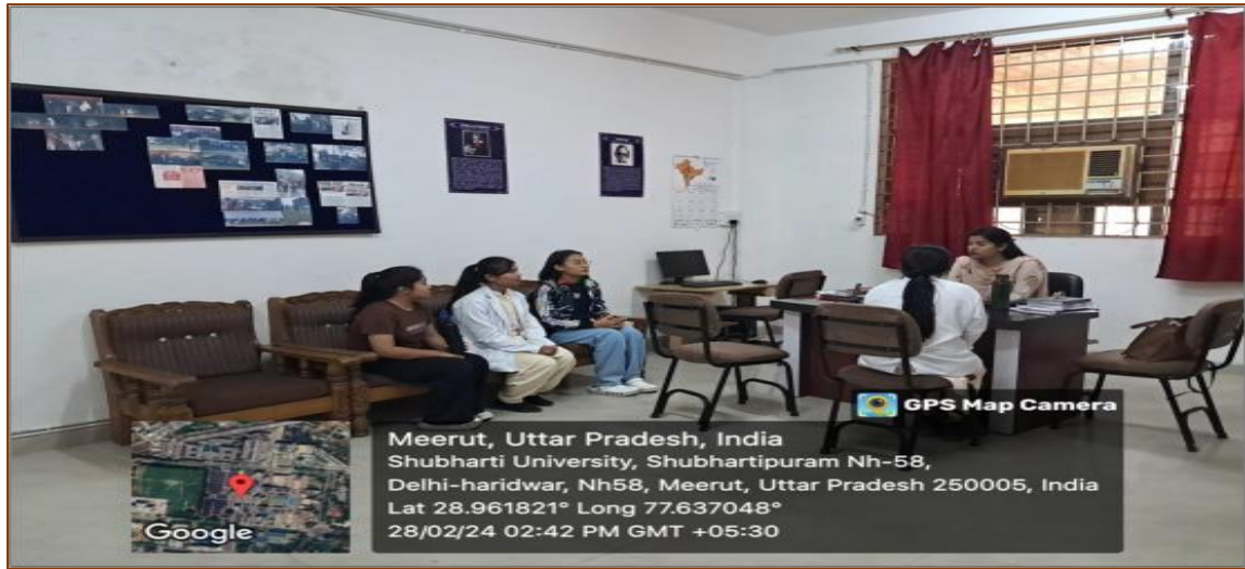
Group Counselling Session