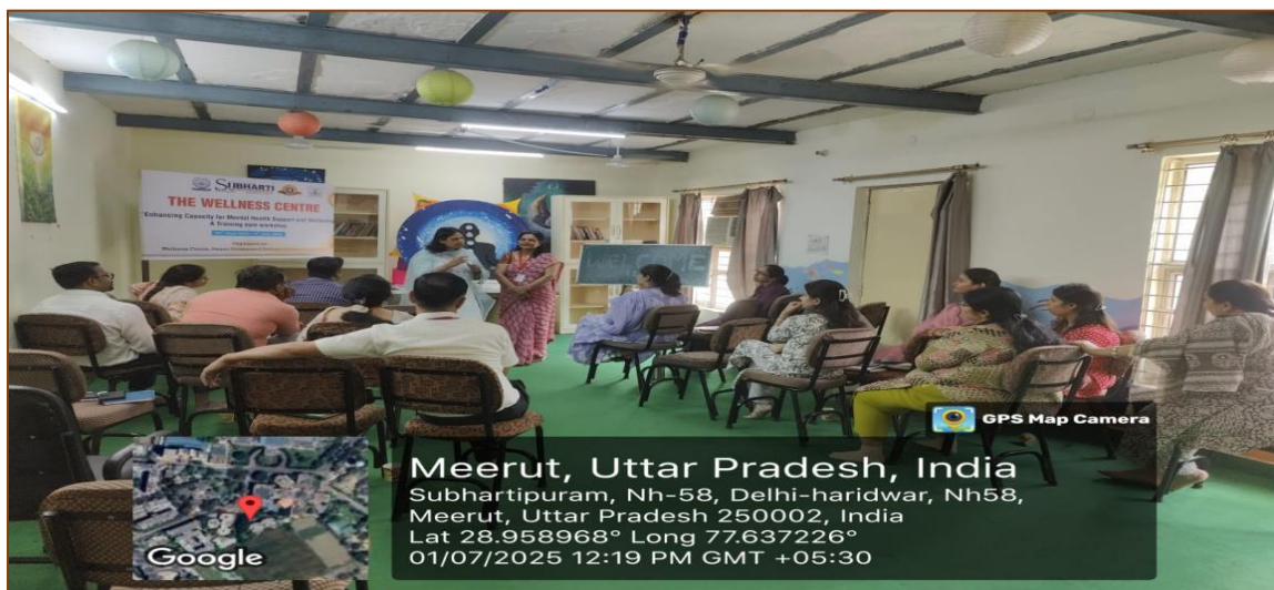
15 Days Training cum Workshop on Mental Health at Swami Vivekanand Subharti University, Meerut

Weblink: https://subharti.org/wellness-centre-subharti-university-india.php